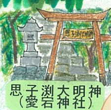
思子瀬大明神 (愛宕神社)