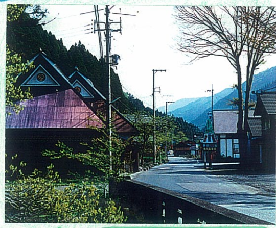
鯖街道沿いの家屋