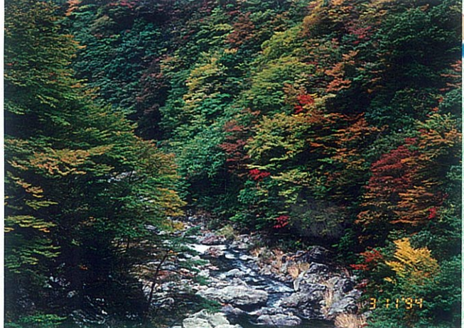
針畑川沿いの景色