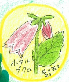
ホタルブクロ 百日草